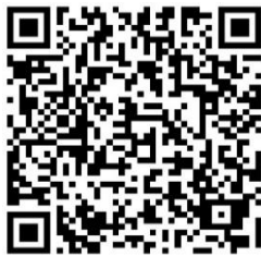
QR-Code Karte des Drei-Kastell-Rundweges