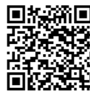
Youtube- Kanal Gemeinde Miehlen

Am 13.12.2022 fand die digitale Einwohnerversammlung statt. Hierbei wurde über aktuelle Themen in der Gemeinde informiert. Ein Schwerpunkt war u.a. der Haushalt für das kommende Jahr. Die Versammlung wurde als Livestream ausgestrahlt. Wer die Versammlung verpasst hat, kann sich dennoch jederzeit in Ruhe die Inhalte noch einmal anschauen , da das Video auf dem Youtube- Kanal der Gemeinde gespeichert ist.